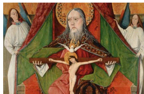
La Santíssima Trinitat (1471), Master GH. Església de la Trinitat, Mosóc (Eslovàquia)

«Déu, donant-nos l'Esperit Sant, ha vessat en els nostres cors el seu amor»