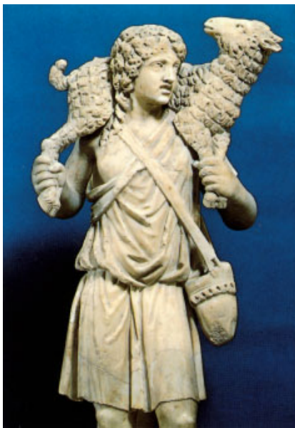
Crist, Bon Pastor (primera meitat del s. iv), Museu de la Ciutat del Vaticà

Yo soy el buen Pastor, que conozco a las mías, y las mías me conocen, igual que al Padre me conoce, y yo conozco al Padre; yo doy mi vida por las ovejas. Tengo, además, otras ovejas que no son de este retil; también a esas las tengo que traer, y escucharán mi voz, y habrá un solo rebaño, un solo Pastor. Por esto me ama el Padre, porque yo entrego mi vida para poder recuperarla. Nadie me la quita, sino que yo la entrego libremente. Tengo poder para entregarla y tengo poder para recuperarla: este mandato he recibido de mi Padre.»