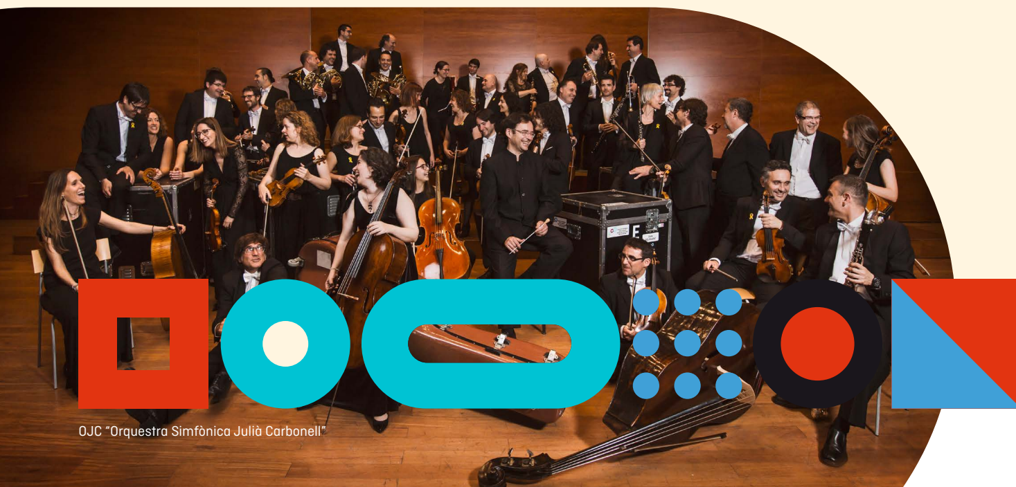
OJC "Orquestra Simfònica Julià Carbonell"

Directora médica de Sant Joan de Déu Terres de Lleida