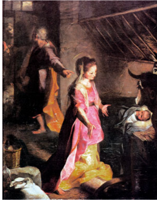
Santa María contemplando a su hijo Jesús. Pintura de Barrocco, Museu del Prado, Madrid

Al cumplirse los ocho días tocaba circumcidar al niño, y le pusieron por nombre Jesús, como lo había llamado el ángel antes de su concepción.