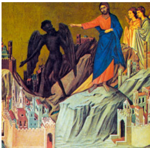
Crist rebutja les temptacions del Maligne. Obra del Duccio (1235-1319), Col·lecció Frick, Nova York

El Señor es bueno y es recto, / y enseña el camino a los pecadores; / hace caminar a los humildes con rectitud, / enseña su camino a los humildes. R.